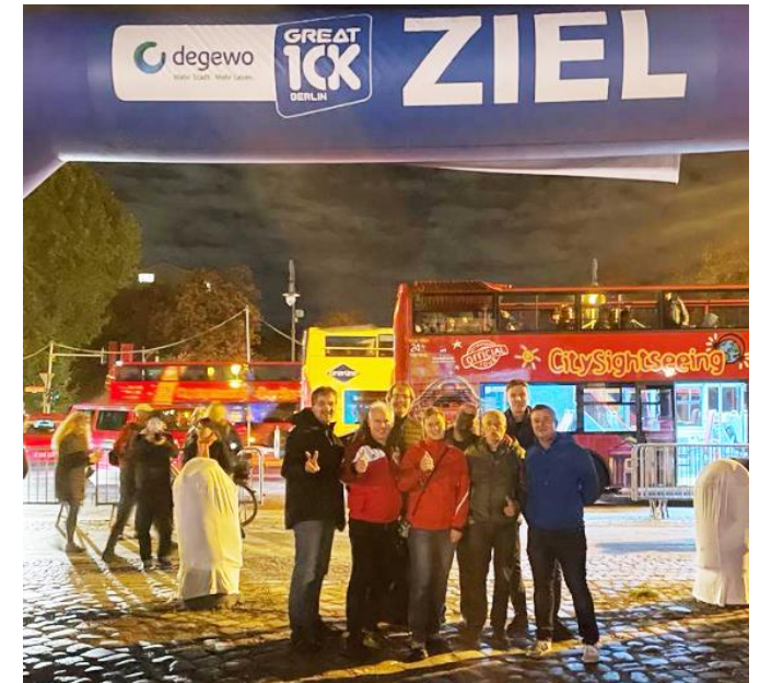
Die PG Sport unterwegs in Berlin im Rahmen ihrer Herbsttagung vom 14.-16.10.2022.