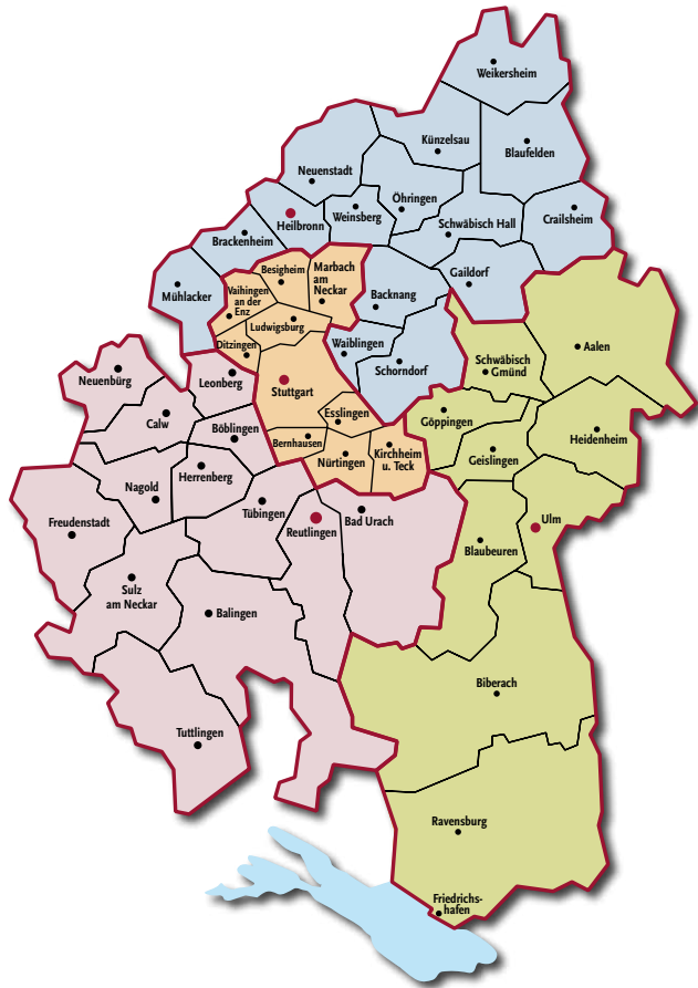
Prälaturen und Bezirksjugendwerke der Evangelischen Landeskirche in Württemberg

Der Christlichen Vereine Junger Menschen Württemberg (CVJM) ist eine Gliederung im EJW. Der Verband christlicher Pfadfinderinnen und Pfadfinder (VCP) ist dem EJW korporativ angeschlossen. Dazu kommen 47 Bezirksjugendwerke und die Landesstelle des EJW in Stuttgart.